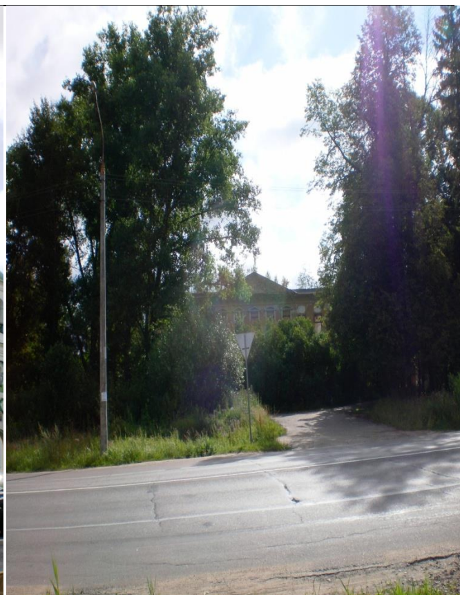
Барская усадьба в Молодах

История села Молоди уже более пятисот лет неразрывно связана с храмом Воскресения Христова: «храм вырастает в округу и нераздельно связан с окружающими людьми».