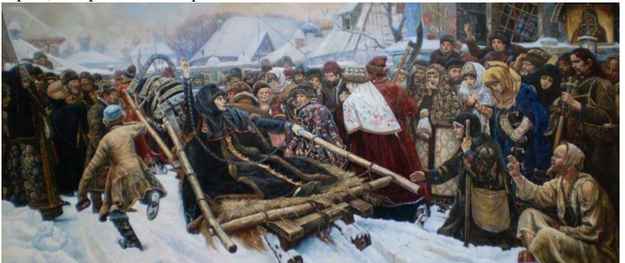
В.И. Суриков. Боярыня Морозова (Государственная Третьяковская галерея, Москва)

Феодосия Прокопьевна была третьим ребенком в семье Соковнина и его супруги Анисьи Наумовой. Она вышла замуж за боярина Глеба Ивановича Морозова, который был намного старше ее - почти на сорок лет, а после смерти супруга молодая вдова попала под влияние протопопа Аввакума, духовного вождя старообрядчества, и стала ревностной защитницей «старой веры», щедрой благотворительницей.