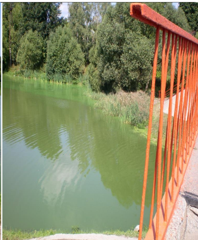
Река Рожайка вблизи села Молоди.