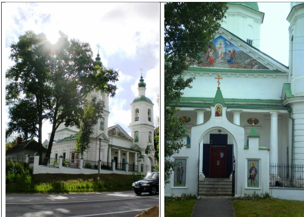
Храм Воскресения Христова в селе Молоди на реке Рожайке.

Первое упоминание церкви Воскресения Христова в Молодях относится к XVI веку. Это связано с историческим событием: победой русского войска над татарским. Российское государство отстояло в битве при Молодях свою независимость и получило передышку от набегов крымских татар почти на двадцать лет.